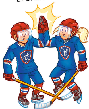
S'AMUSER AVEC LES COPAINS ET LES COPINES