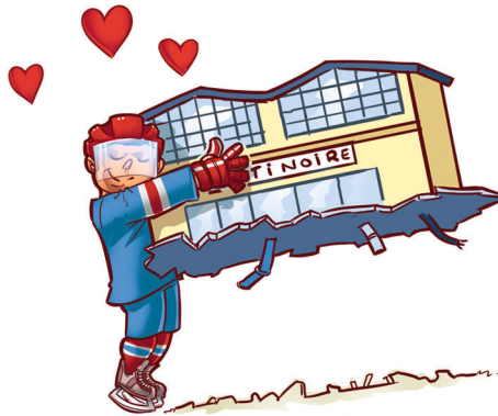
RESPECTE LE MATÉRIEL, LE VESTIAIRE ET LA PATINOIRE