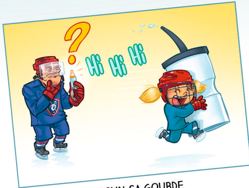
CHACUN SA GOURDE POUR BIEN S'HYDRATER