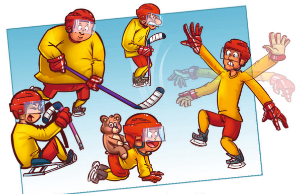
ÊTRE OUVERT À TOUS