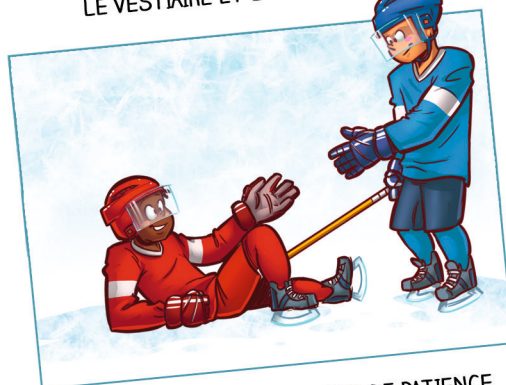
FAIRE PREUVE DE FAIR PLAY ET DE PATIENCE