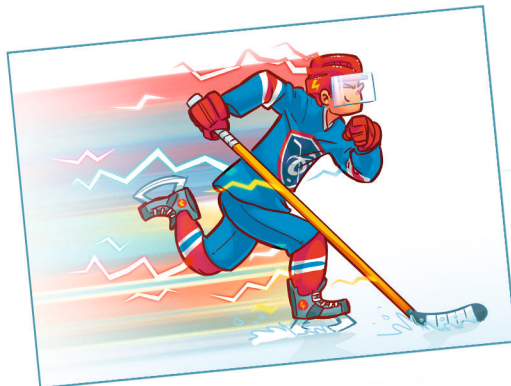
DE LA VITESSE ET DE LA GLISSE