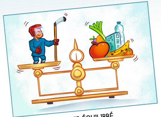
MANGER ÉQUILIBRÉ POUR ÊTRE EN FORME