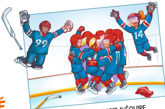
DÉVELOPPER L'ESPRIT D'ÉQUIPE ET ÊTRE SOLIDAIRE