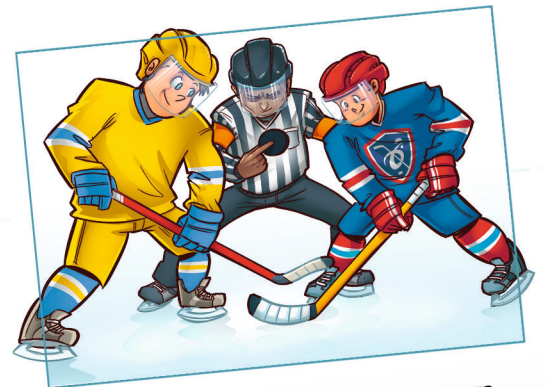
LE PLAISIR DE JOUER ET DE PERFORMER

TROUVE UN CLUB PRÈS DE CHEZ TOI SUR HOCKEYFRANCE.COM