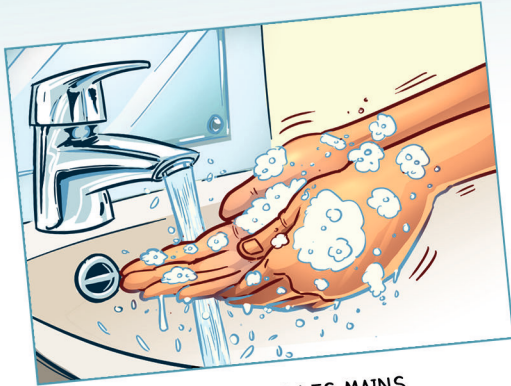
BIEN SE LAVER LES MAINS