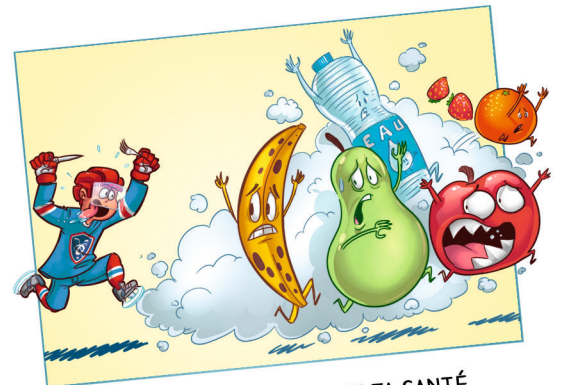
RESPECTE TON CORPS ET TA SANTÉ